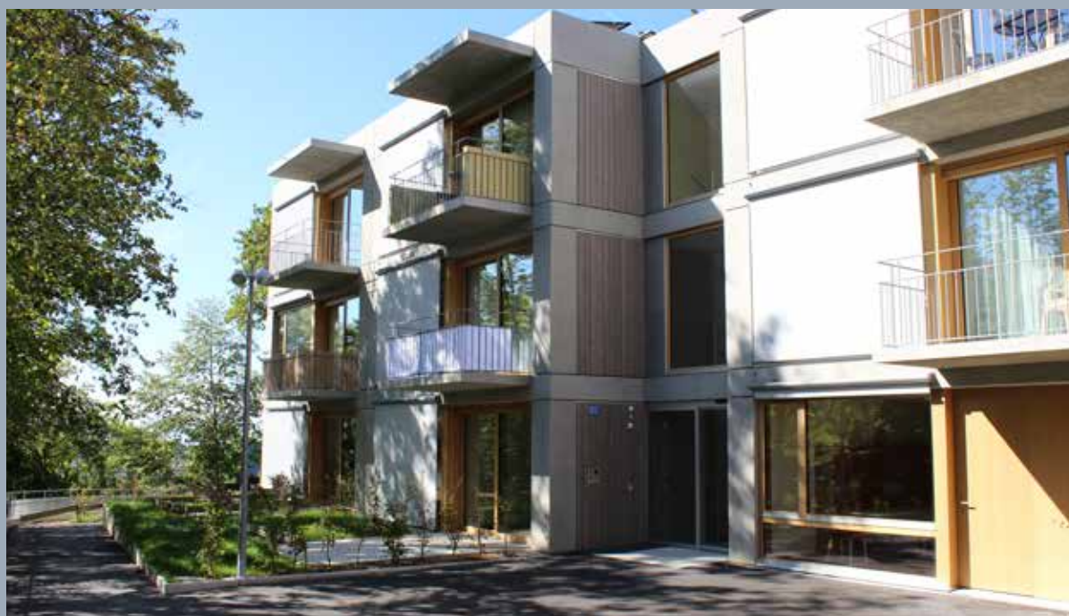
L'Orée de Plein Soleil accueille ses premiers locataires