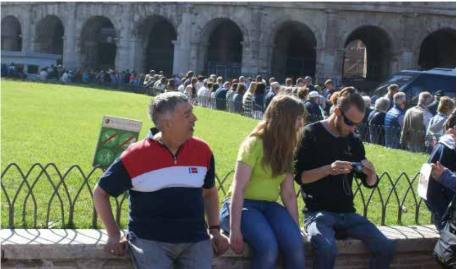
Voyage à Rome